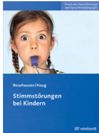
Beushausen, Ulla / Haug, Claudia Stimmstörungen bei Kindern (2011)