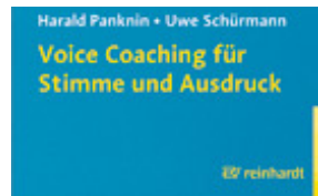
Panknin, Harald / Schürmann, Uwe Voice Coaching für Stimme und Ausdruck (2008)