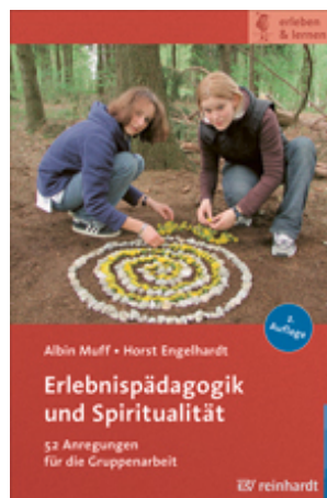
Muff, Albin / Engelhardt, Horst Erlebnispädagogik und Spiritualität (2013)