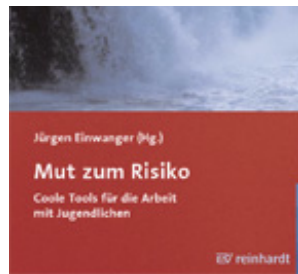
Einwanger, Jürgen (Hrsg.) Mut zum Risiko (2007)